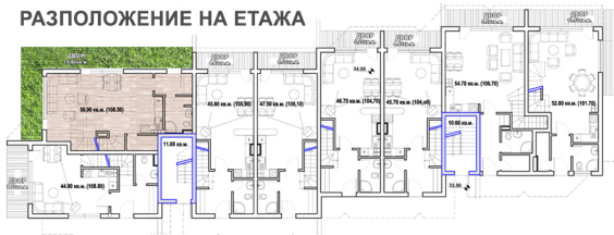
РАЗПОЛОЖЕНИЕ НА ЕТАЖА

Хол с трапезария и кухня, санитарно помещение, склад и двор